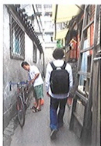
金玉米简直就是个胡同串子,熟门熟路的样子仿佛他生来就住在这里。