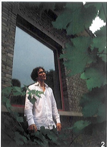
①日坛公园是金玉米最喜欢去的地方,如此休闲、放松。他情不自禁在论坛上做了一个倒立,显示了深厚的体操功底。